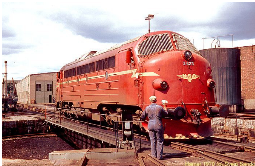
Di 3 lok i drift sedan slutet av 1950 talet