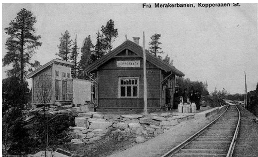
Kopperå stn ca 1900