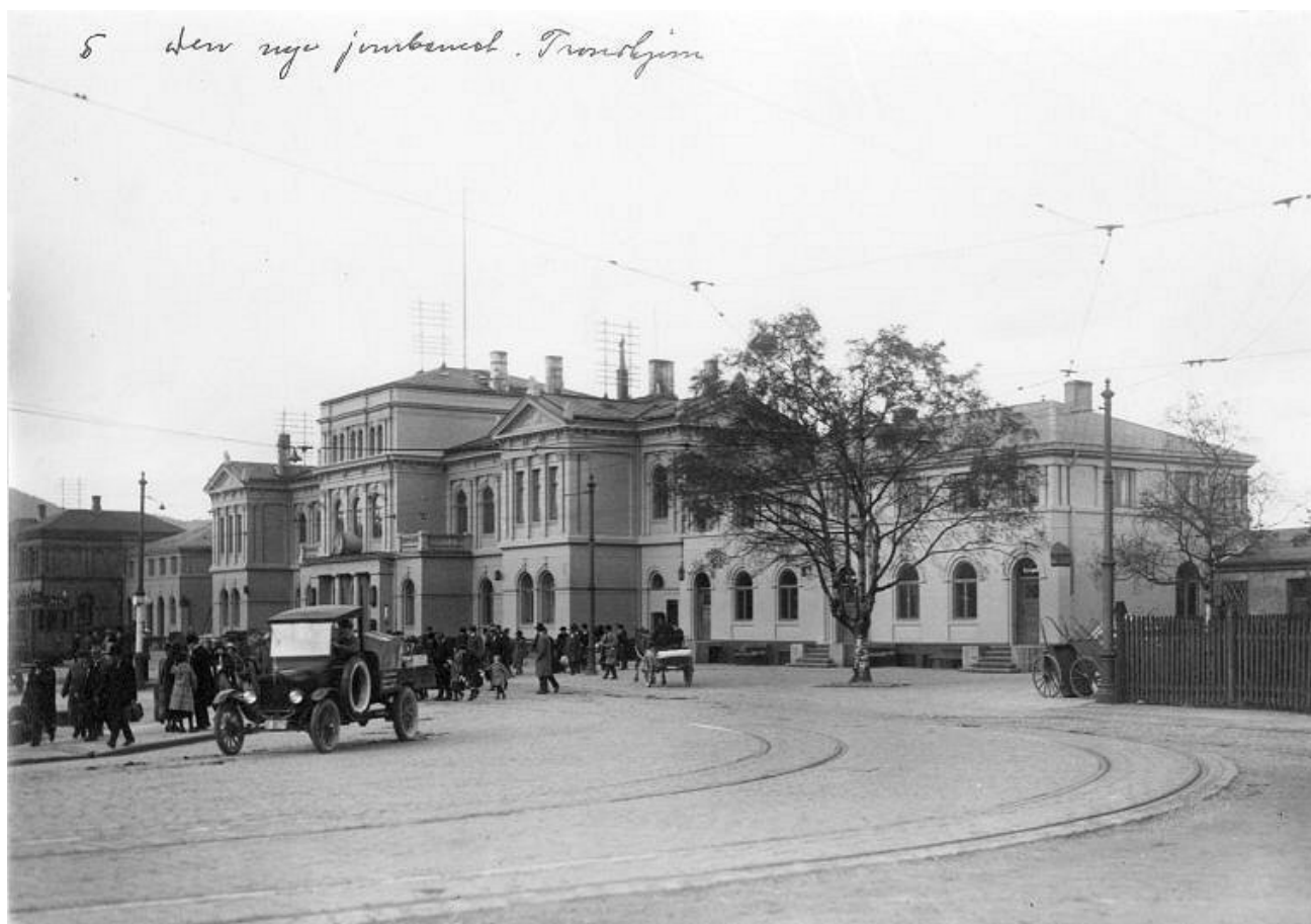
Trondhjem nye jernbanestasjon 1925