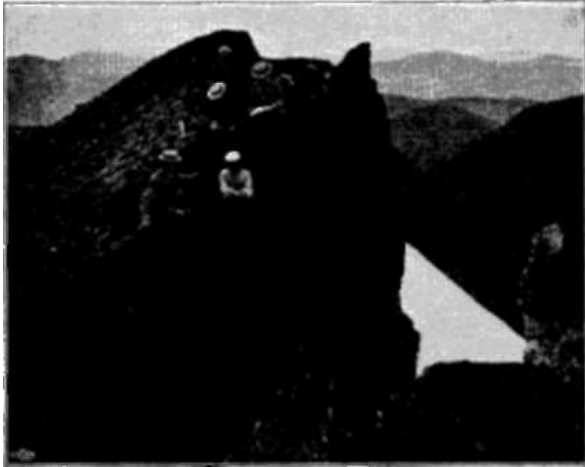
Uppe på Sylen.

skymmande bergen se lätta, halvt genomskinliga ut, man kunde inbilla sig, att de vore sagolikt stora skimrande rubiner. Men trolleriet varar inte länge. Den dröjande solglansen, som fångades av bergen, är snart försvunnen, och Snasahögarna äro åter gråa och tunga. Men den, som sett det skådespelet en sommarafton, glömmet det aldrig.