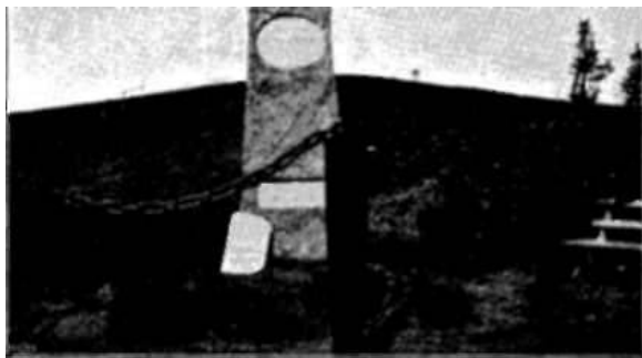
Karolinergraven i Änn.

baka till Sverige. Det var mitt i vintern och en våldsamt köld, de stackars soldaterna kunde icke taga sig fram över de stora ödemarkerna till bygden, utan de flesta frös efter oerhörda lidanden ihjäl. Man har på flera ställen i västra Jämtland funnit ben och vapen efter dem, och i Änn lära 300 man ha blivit begravna.