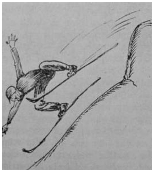
Flygfärd. (Efter C. J. Luther).

Skurdalshöjden. När under uppfarten vädret klarnade, var det svårt att återhålla ett utrop av beundran inför de imponerande, storslagna fjällviddsvyer, som den vikande dimman äntligen släppte ur sitt famntag. Det hurrades för solen ibland. Den lilla uppmärksamheten kunde behövas, ty det rödgula klotet, vars belysning målar fjällvärlden i fantastiskt sköna färger, visade en påfallande benägenhet att gömma sig bakom dimslöjor och snögardiner. Summa tre dagar hade vi riktigt vackert väder. Men hur tacksamma voro vi ej därför!