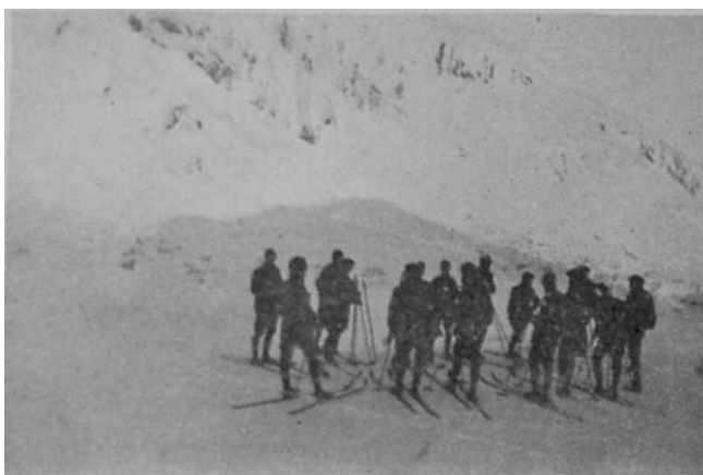
Ravin, rast, rådplägnig.