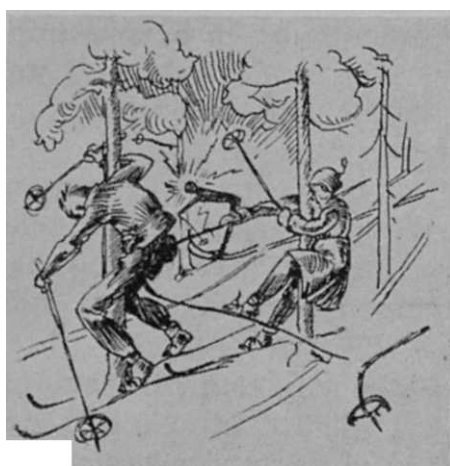
Utförlöpning nedom trädgränsen (Efter C. J. Luther).

Farten uppför fjällsidan var aldrig överdrivet hög. Vi gingo i regel i två spår, ofta mycket hala. Det är, som varje skidlöpare vet, inte så enkelt att valla så, att skidorna gå lätt framåt och — bara framåt. Och det var förvisso mer än en, som bittert ångrade, att han på morgonen behandlat sina skidor med paraffin. Stundom hindrades framryckningen effektivt av "något", som låg i spåret, något, som långsamt kravlade sig fram och visade sig vara en människa, försedd med armar och ben och skidor och stavar. Råkade det vara den för sin jovialitet och sitt kamratliga väsen allmänt uppskattade tungviktaren "B. från G.", så tog manövern lång tid. Han var särdeles kontant med moder jord och påverkad av dess dragningskraft. Och det hände, att endast skidorna stannade över snötäcket, markerande den plats, där ägaren försvunnit. — Trots sådana hinder, som naturligtvis inte alls verkade nedsättande på den glada stämningen i gruppen, nåddes småningom det icke nämnvärt svårbestigliga fjällets topp. En stunds vila, orientering och fotografering, och så följde en snabb nerfärd, som gav full valuta för strapatserna. För åtskilliga av oss var en dylik njutning hittills okänd. Kilometerlånga, lagom branta löpor är det ju inte gott om söder om fjällregionerna*